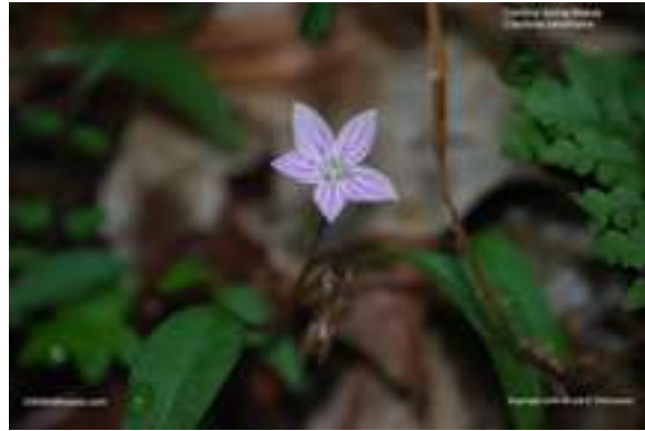
Spring Beauty - Claytonia caroliniana