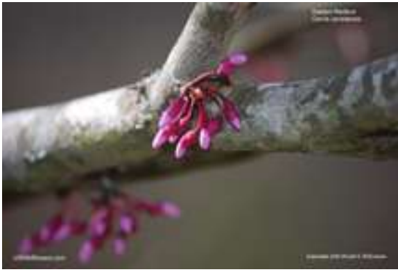
Eastern Redbud - Cercis canadensis