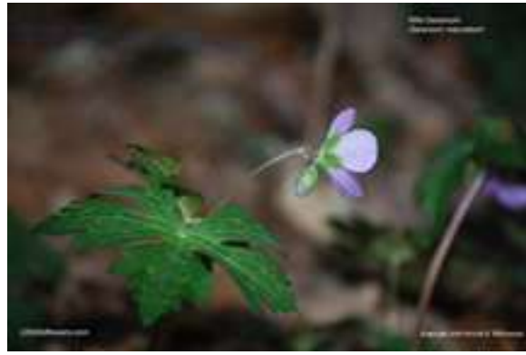
Wild Geranium - Geranium maculatum