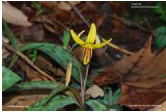
Dogtooth Violet - Erythronium americanum