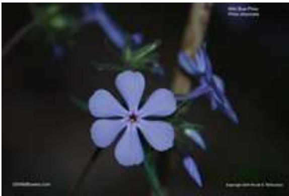
Wild Blue Phlox - Phlox divaricata