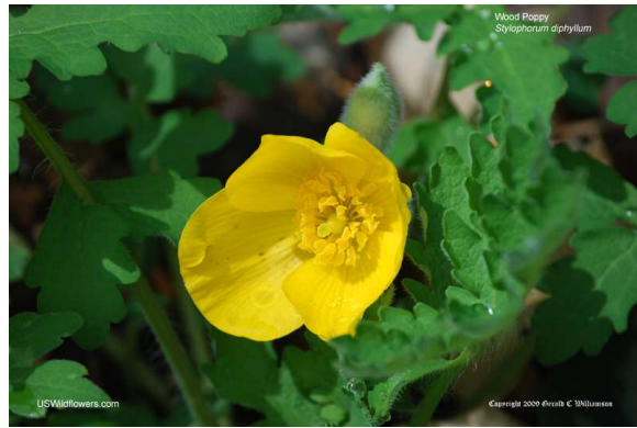
Wood Poppy - Stylophorum diphyllum