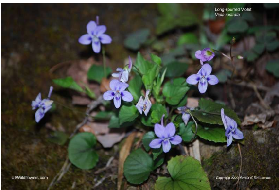
Long-spurred violet - Viola rostrata