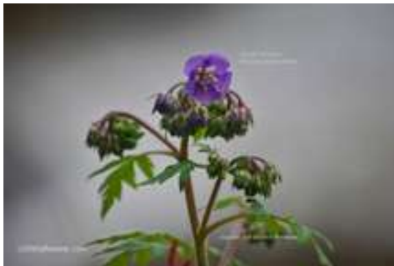
Purple Phacelia - Phacelia bipinnatifida