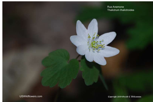
Rue Anemone - Thalictrum thalictroides