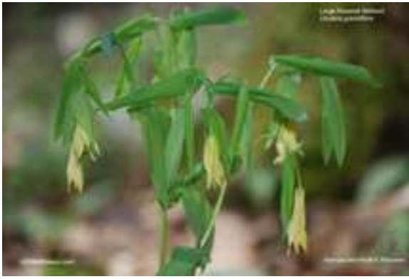
Bellwort - Uvularia grandiflora