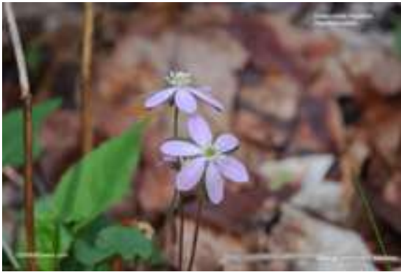
Sharp-lobed Hepatica - Hepatica nobilis