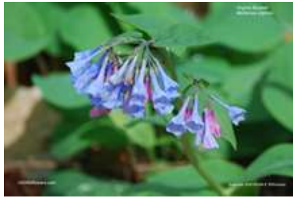
Virginia Bluebell – Mertensia virginica