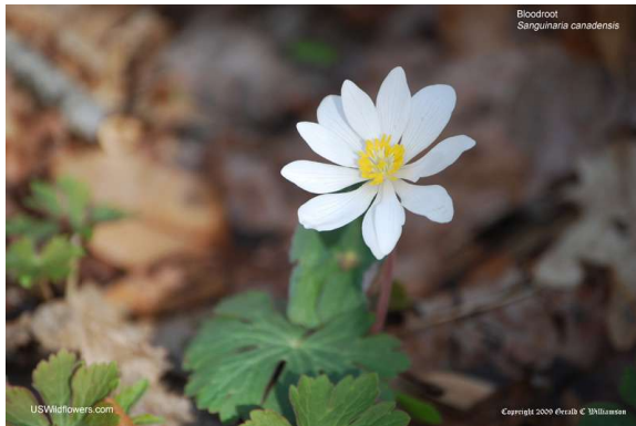
Bloodroot - Sanguinaria canadensis